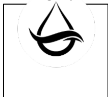
Slika 6: Logotip