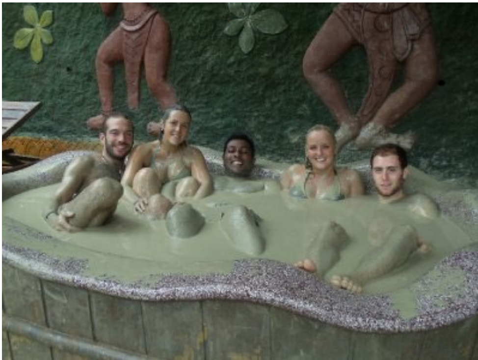
Slika 2: Blatna kopel

8– Izboljša delovanje ščitnice – Nekatere študije kažejo, da lahko jemanje glinenih dodatkov pomaga pri uravnaneženem delovanju ščitnice.