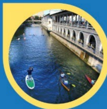
Slika 8: Otvoritvena ponudb