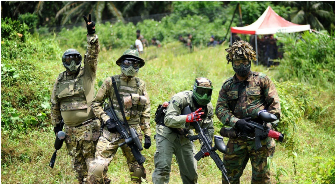
Slika 3: Paintball

- paintball: Paintball je adrenalinski šport, ki ga lahko igrajo tako moški kot ženske skoraj vseh starosti. Zanimiv je predvsem zato, ker ni odvisen od fizične moči ali starosti posameznega tekmovalca, saj je to ekipna igra, pri kateri je pomembno hitro odločanje in komunikacija znotraj posamezne ekipe. V igri sta združene tako avantura kot tudi športne aktivnosti.