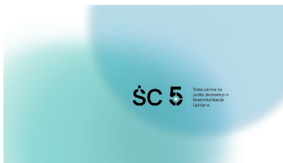
Slika 1: Naslov slike (slike imajo sredinsko poravnavo, napis je pod sliko)

(vir slike je v vrstici pod naslovom tabele)